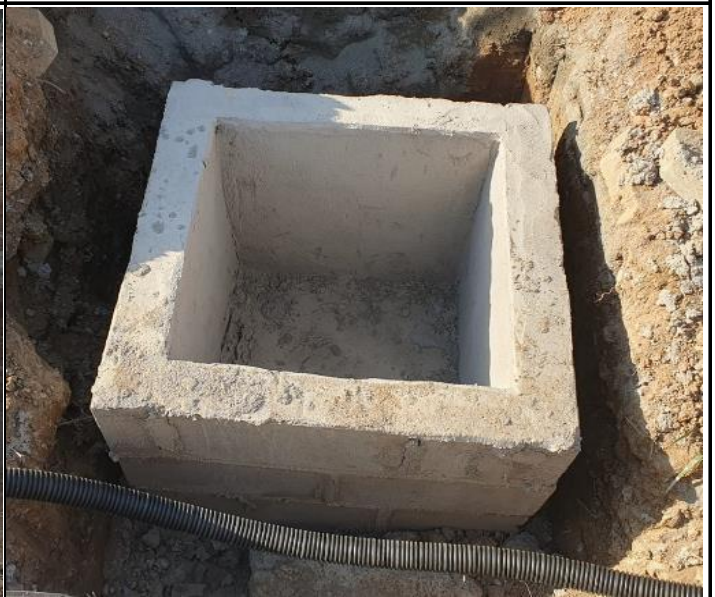
Foto 28 - Construção de caixas de areia para drenagem de água pluvial.