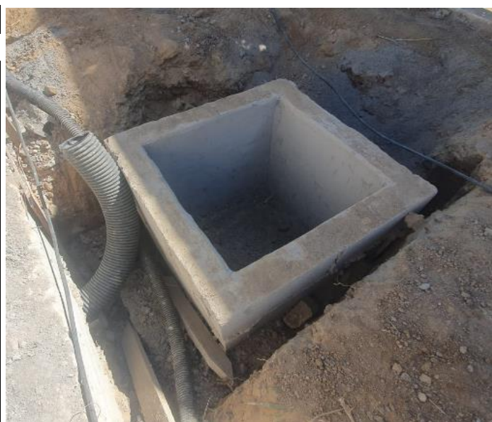
Foto 45 - Construção de caixas de areia para drenagem de água pluvial.