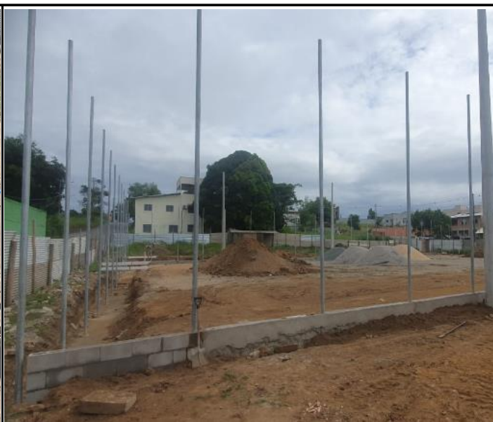
Foto 14 – Construção em alvenaria do confinamento lateral do campo.