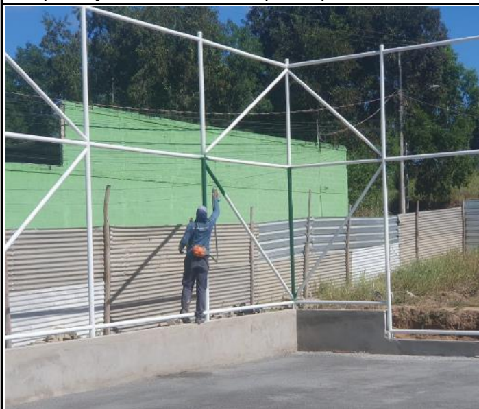
Foto 43 - Pintura de tubos do alambrado.