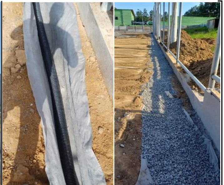
Foto 34 - Execução do sistema de drenagem do campo, com tubo PEAD corrugado perfurado.