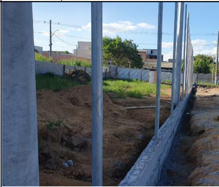
Foto 16 - Chapisco em alvenaria de confinamento lateral do campo.