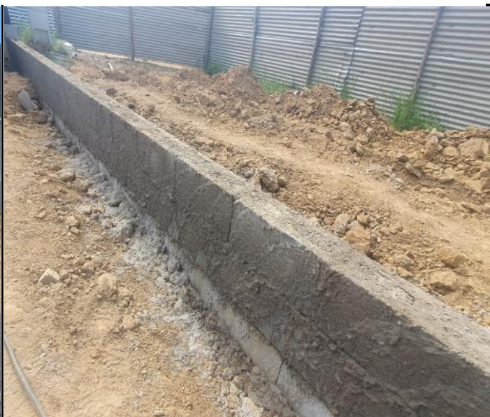
Foto 38 - Chapisco em alvenaria.