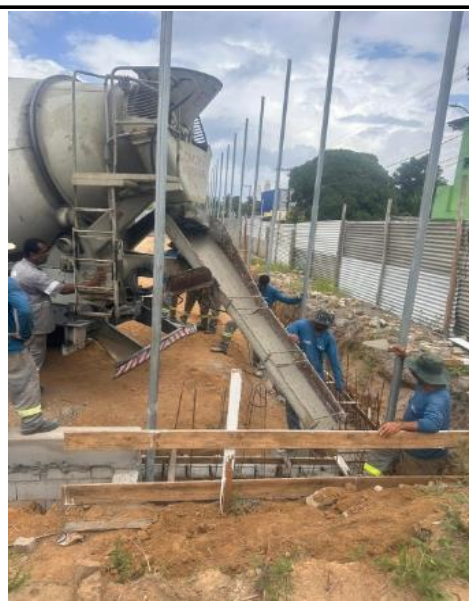
Foto 18 - Concretagem da base das contenções.