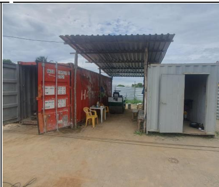
Foto 22 - Montagem de Canteiro de Obras.