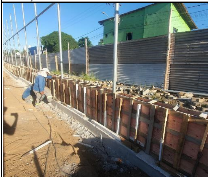
Foto 19 - Montagem de forma e aço das contenções em concreto armado.