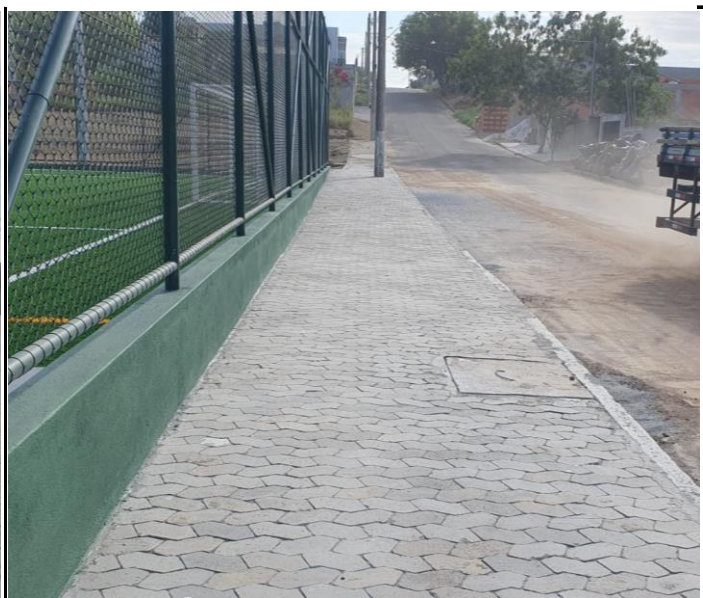
Foto 50 - Caixas de Passagem.