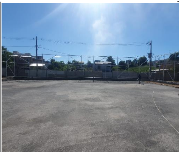
Foto 42 - Espalhamento, regularização e compactação de camada de pó de pedra.