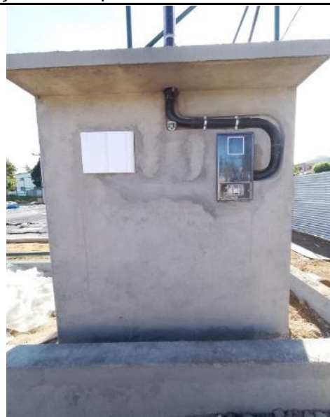
Foto 48 - Mureta do padrão de energia.