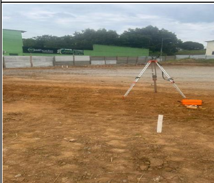
Foto 07 – Demarcação de níveis de terreno com auxílio de equipe topográfica.