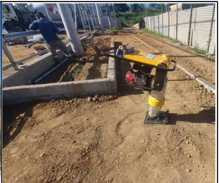
Foto 26 - Reaterro compactado de rampas e calçada externa.