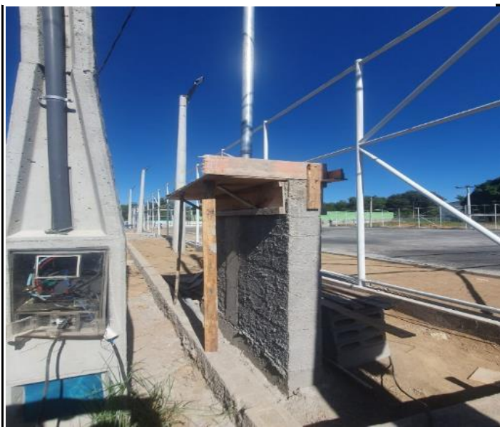
Foto 46 - Chapisco de alvenaria do padrão e construção do chapim.