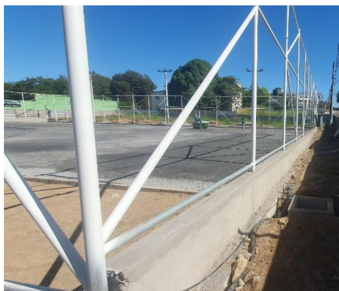
Foto 41 - Espalhamento, regularização e compactação de camada de pó de pedra.