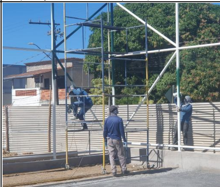
Foto 44 - Pintura de tubos do alambrado.