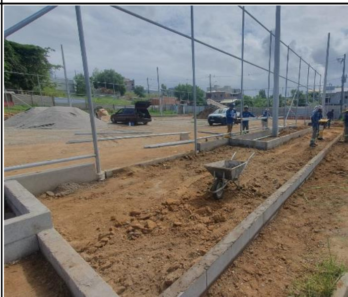
Foto 24 - Reaterro compactado de rampas e calçada externa.