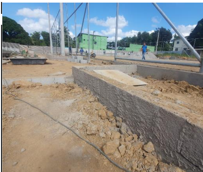
Foto 37 - Chapisco em alvenaria.