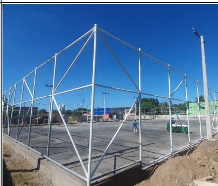
Foto 40 - Espalhamento, regularização e compactação de camada de pó de pedra.