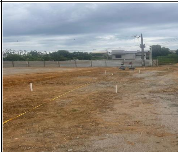
Foto 08 – Demarcação de níveis de terreno com auxílio de equipe topográfica.