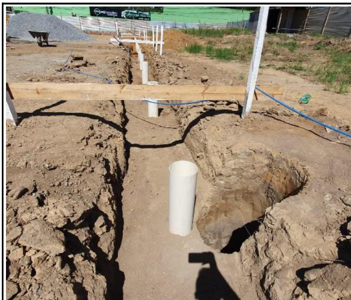
Foto 13 – Posicionamento dos tubos PVC 200mm para fundação do alambrado.