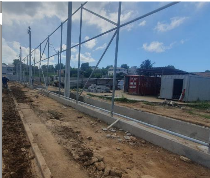
Foto 33 - Construção com meio fio de área técnica, reaterro e compactação.