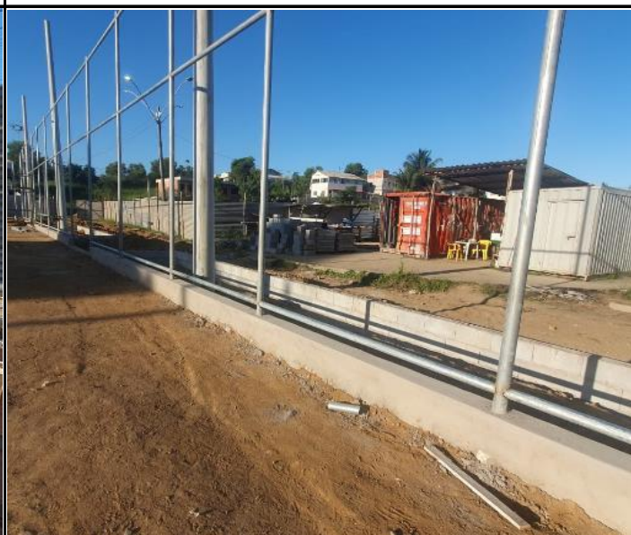
Foto 20 - Reboco em alvenaria de confinamento lateral do campo.