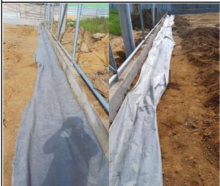
Foto 31 - Aplicação de manta drenante nas extremidades do campo.