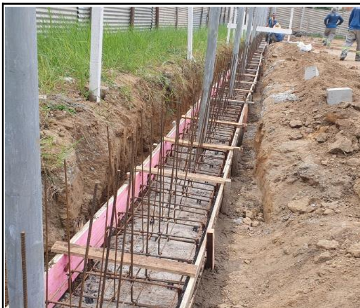
Foto 17 - Concreto magro, forma e aço das contenções em concreto armado.