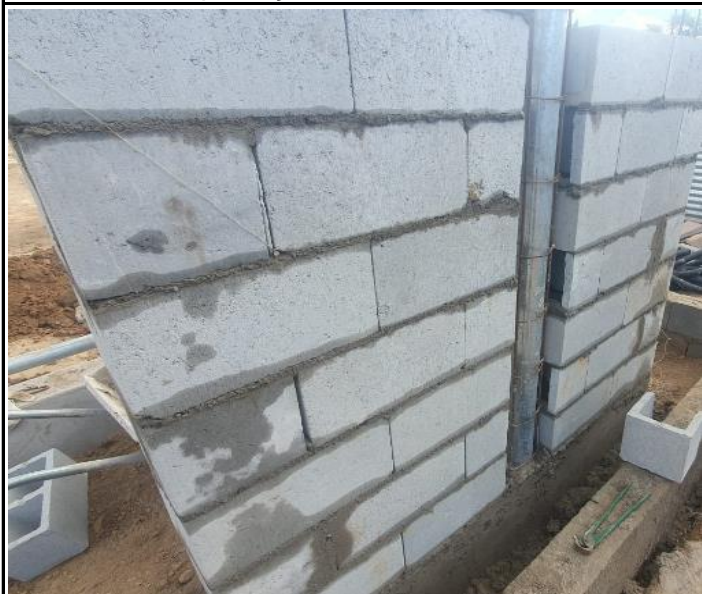
Foto 35 - Construção em alvenaria do padrão de energia.