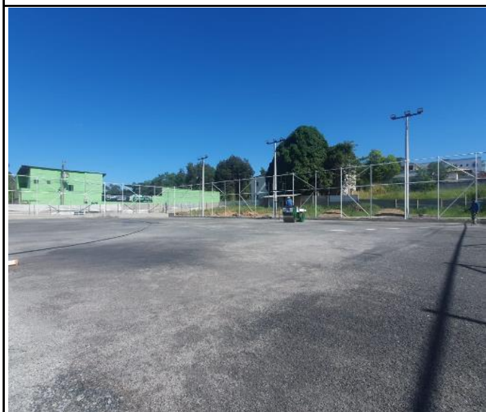
Foto 39 - Espalhamento, regularização e compactação de camada de pó de pedra.