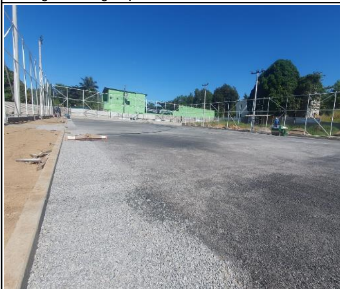
Foto 47 - Compactação de camada de pó de pedra.