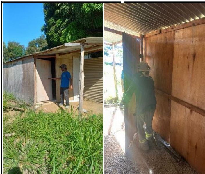
Foto 21 - Montagem de Barracão e Canteiro de Obras.