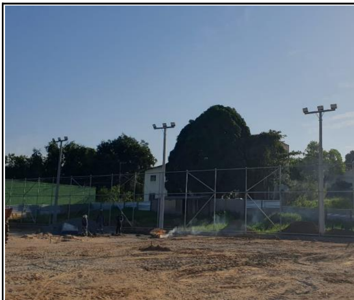
Foto 29 - Postes de Iluminação.