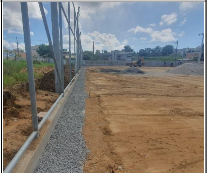
Foto 36 - Sistema de drenagem do campo.