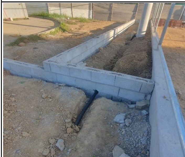
Foto 23 - Construção em Alvenaria de Canteiros e Rampa.