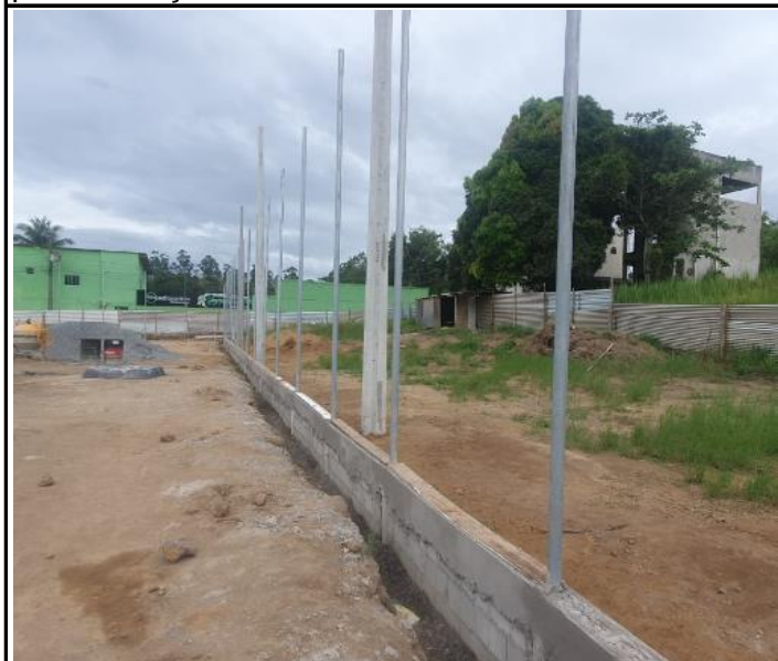
Foto 15 - Construção em alvenaria do confinamento lateral do campo.