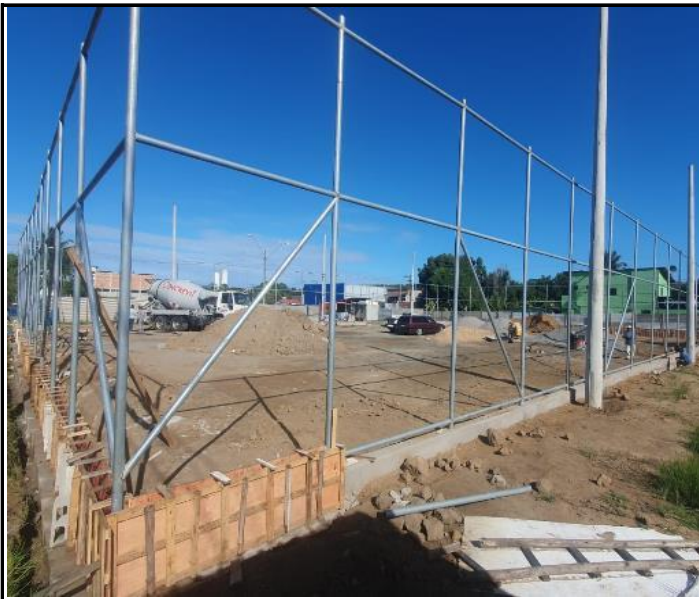
Foto 25 - Visão geral da obra, concretagem da contenção.