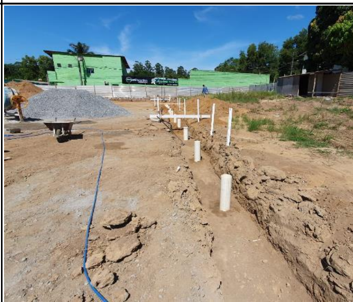
Foto 12 – Posicionamento dos tubos PVC 200mm para fundação do alambrado.