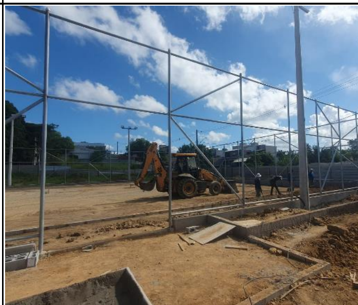
Foto 32 - Regularização e compactação de área aterrada.