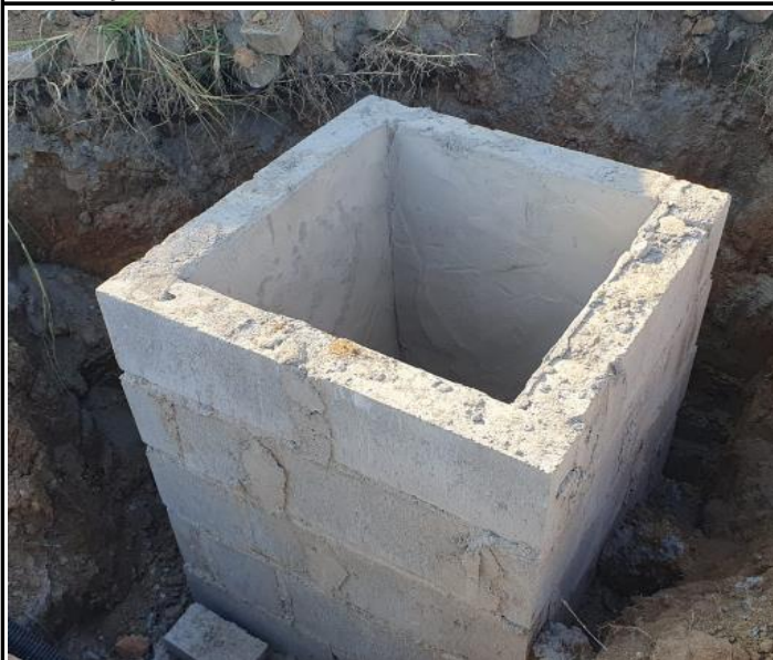
Foto 27 - Construção de caixas de areia para drenagem de água pluvial.