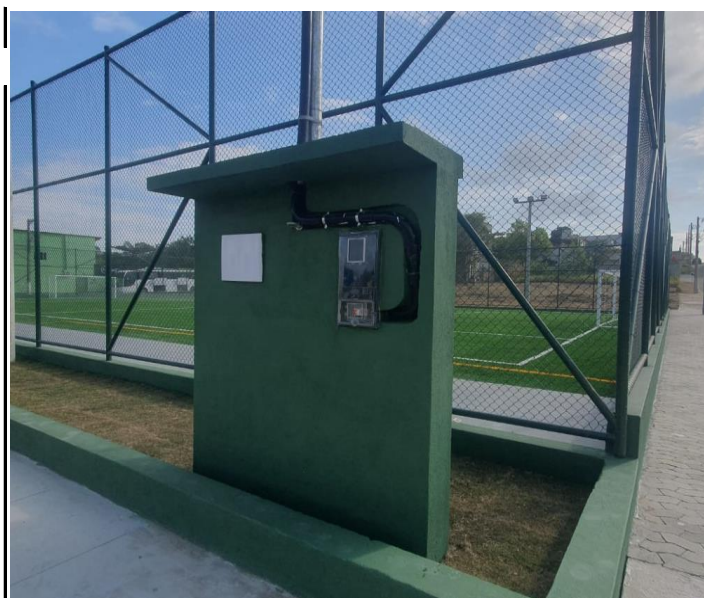
Foto 49 - Mureta do padrão de energia.