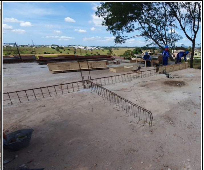
Foto 16 - Montagem de reforço estrutural de vigas sobre a laje de cobertura.