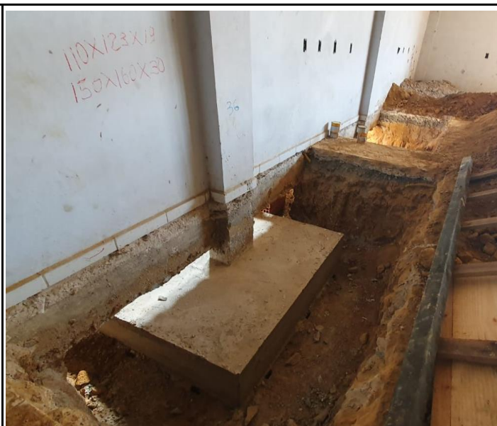
Foto 18 - Sapata concretada.