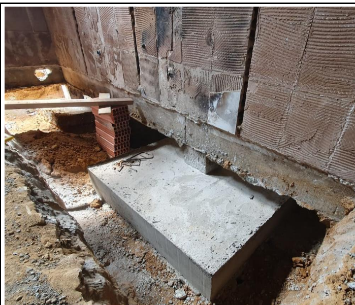
Foto 17 - Sapata concretada.