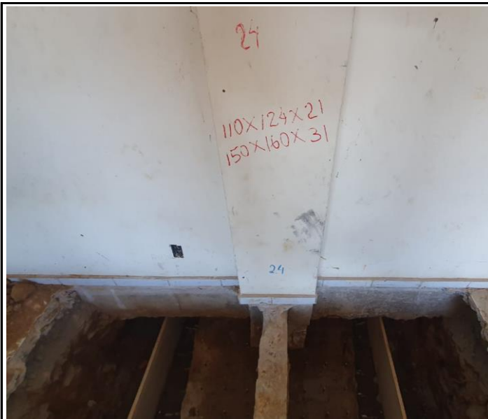
Foto 05 – Montagem de aço e forma para reforço estrutural em sapata.