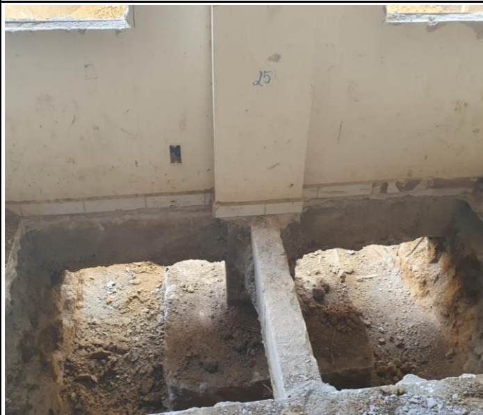
Foto 15 - Escavação de Sapatas.