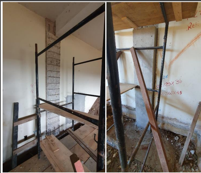
Foto 13 – Montagem de aço e forma para reforço estrutural em pilar.