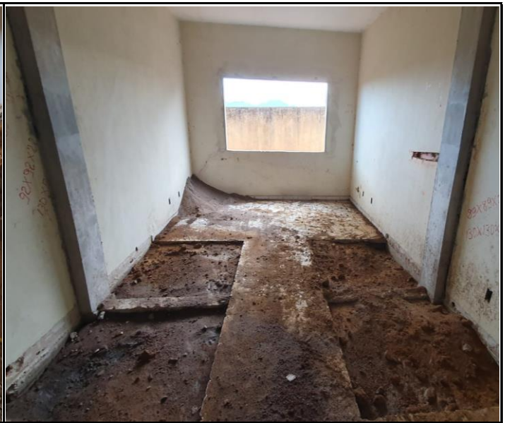
Foto 02 – Reaterro compactado de sapatas concretadas / Pilares concretados.